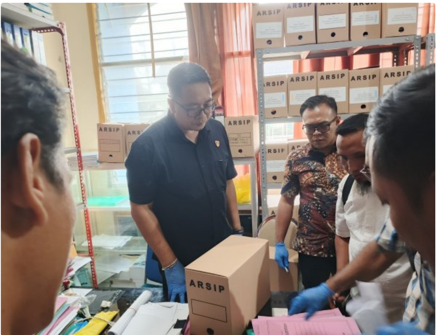
Saat Pengeledahan di Dikbud NTB, Jumat (13/12/2024)